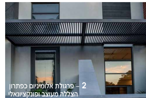
2 - פרגולת אלומיניום כפתרון הצללה מעוצב ופונקציונאלי

סגנונות הרטרו והוינטאג' הם סוג של מחווה וגעגוע למה שהיה כאן פעם, התחזקת אחר סגנונות העיצוב ששלטו כאן בעשורים רחוקים, שנות ה-50 וה-60 של המאה הקודמת, המביאים עמם מראה חמים יותר וביתי. עיצוב בסגנון וינטאג' יוצר את האזיון הנכון אותו אנו מבקשים היום עיצוב המעניק מגע מיוחד החושף את הנשמה. שערים וגדרות בעיצוב וינטאג' מעניק מראה ייחודי, אותנטי ויוקרתי. (תמונה 7)