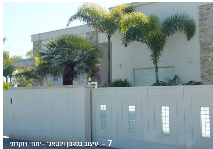
7 - עיצוב בסגנון וינטאג' - ייחודי ויוקרתי