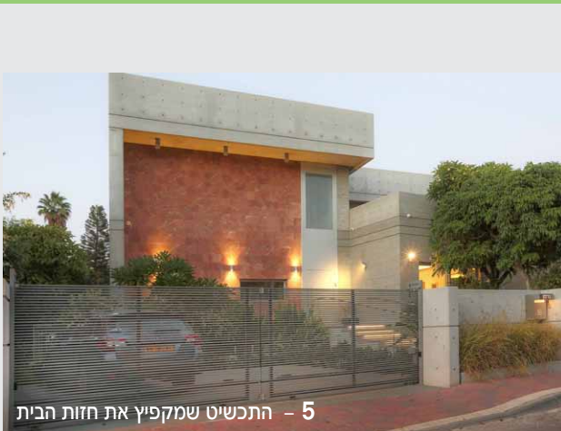
5 - התכשיט שמקפיץ את חזות הבית