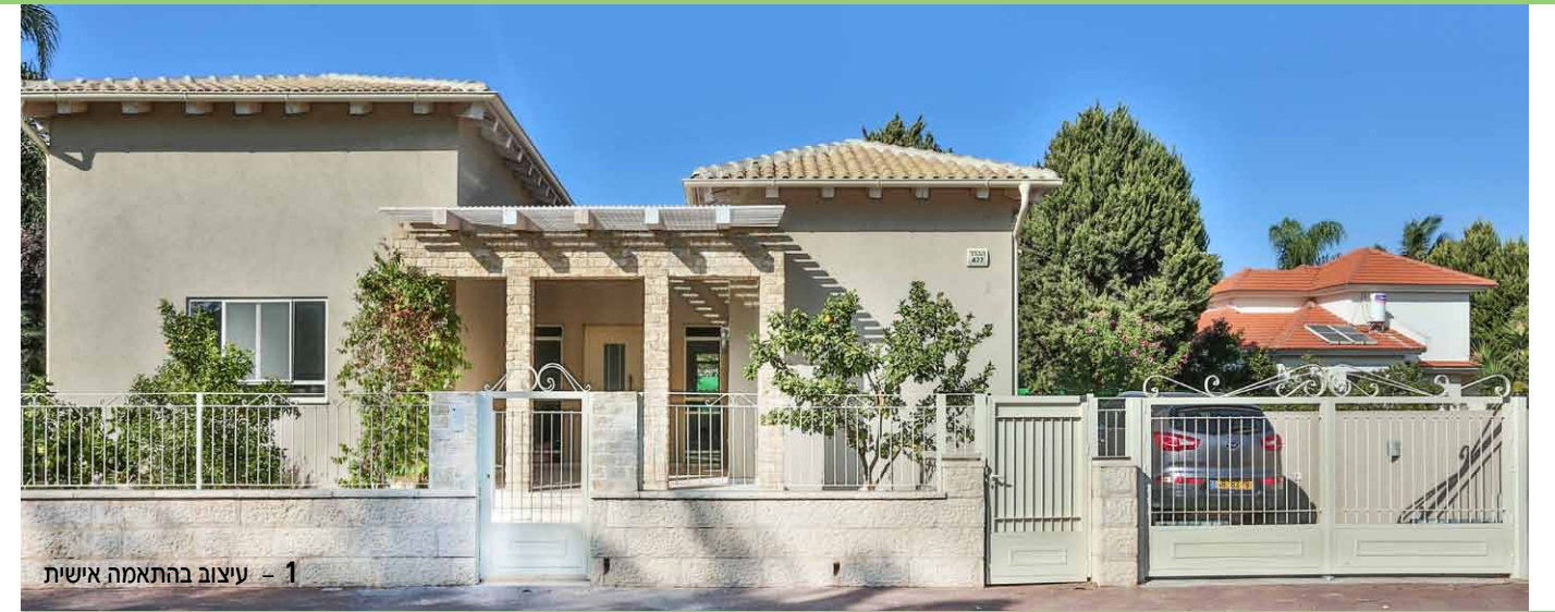
1 - עיצוב בהתאמה אישית

חברת פרופיל מעניקה פגישת ייעוץ ללא תשלום. החודש משיקה החברה את הקטלוג החדש שלה לשנת 2017, לקביעת פגישה ו/או לקבלת הקטלוג ניתן ליצור קשר.