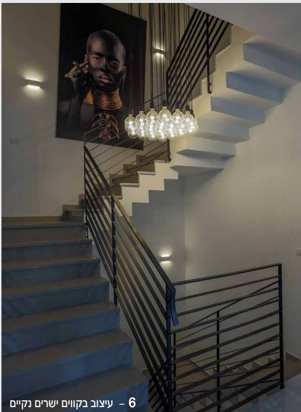
6 - עיצוב בקווים ישרים נקיים

טלפון: 09-7665290 www.iprofil.co.il info@iprofil.co.il