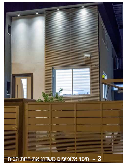
3 - חיפוי אלומיניום משדרג את חזות הבית