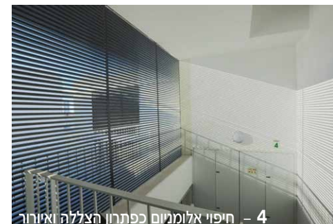
4 - חיפוי אלומיניום כפתרון הצללה ואיור