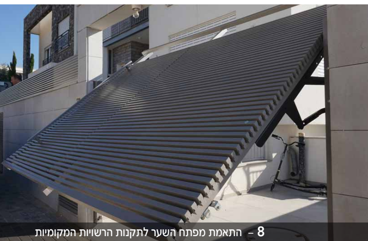
8 - התאמת מפתח השער לתקנות הרשויות המקומיות